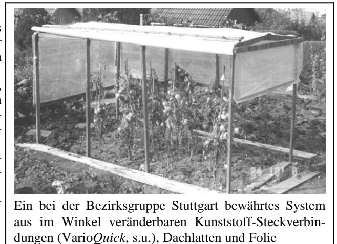
Ein bei der Bezirksgruppe Stuttgart bewährtes System aus im Winkel veränderbaren Kunststoff-Steckverbindungen (VarioQuick, s.u.), Dachlatten und Folie

Aufgrund der sich häufenden „Starkwindereignisse“ sollte auf eine gute Verankerung im Boden sowie auf eine ausreichende Seitenstabilität durch Verstreben geachtet werden.